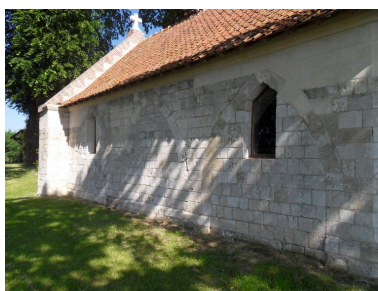
Mur sud. IVR22_20108010154NUCA