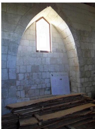
Vue intérieure. Première arcature (mur sud). IVR22_20108010133NUCA