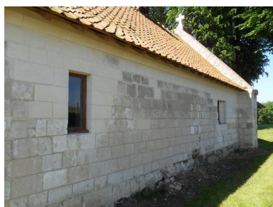
Mur nord. IVR22_20108010153NUCA