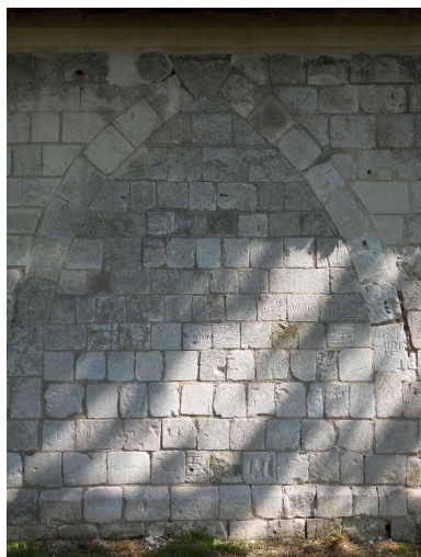
Deuxième arcature mur sud.