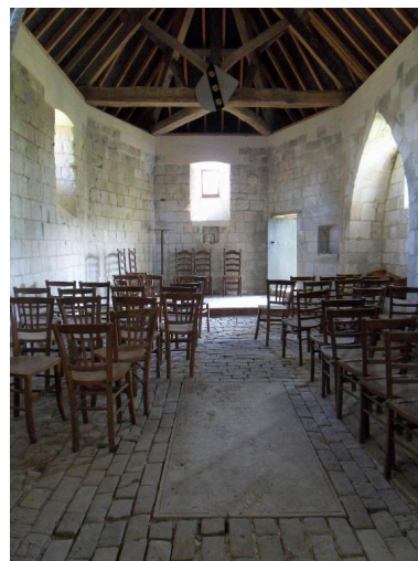
Vue intérieure vers le chœur. IVR22_20108010130NUCA