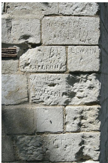
Graffitis gravés sur le mur de la chapelle.

Phot. Marie-Laure Monnehay-Vulliet IVR22_20118000421NUCA