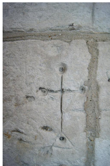
Croix funéraire. Graffiti gravé sur le mur de la chapelle.

Phot. Marie-Laure Monnehay-Vulliet IVR22_20118000429NUC2A