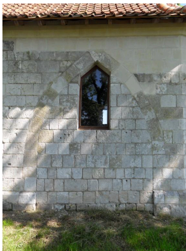
Troisième arcature mur sud. IVR22_20108010157NUCA