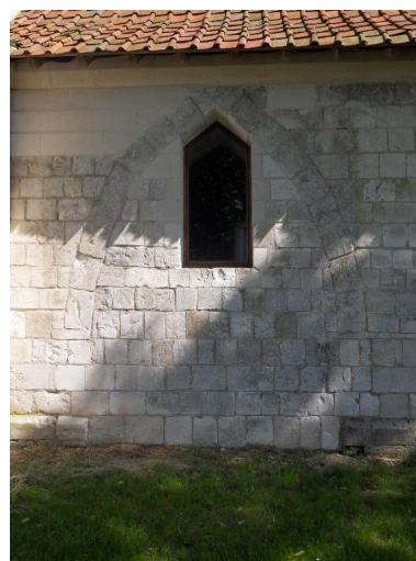
Première arcature mur sud. IVR22_20108010155NUCA