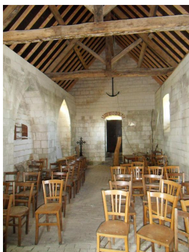
Vue intérieure vers l'entrée.