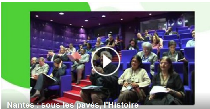
Nantes : sous les pavés, l'Histoire

A la découverte de la crypte qui se cache sous la place de la République... Deux fois par semaine, le public peut visiter l'important chantier de fouilles qui a pris place en centre ville. Objectif : comprendre l'histoire de la ville mais aussi le travail des archéologues qui doivent analyser les couches de vestiges enchevêtrées.