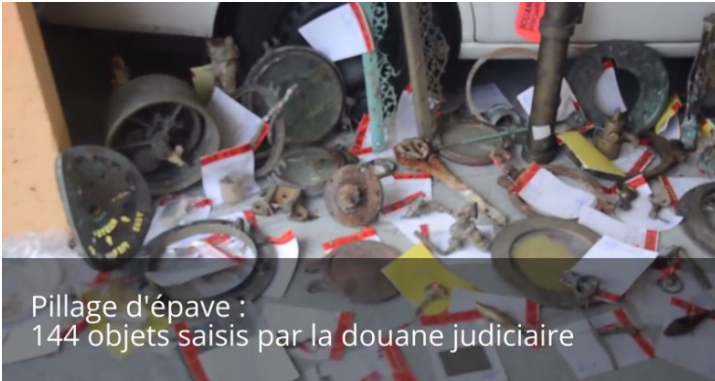
Pillage d'épave : 144 objets saisis par la douane judiciaire

Bretagne: 2 retraités interpellés pour pillage archéologique d'épaves. Un total de 144 objets, issus du pillage au cours des 30 dernières années de nombreuses épaves des alentours de l'île de Sein, ont été retrouvés au domicile des deux retraités, âgés de 61 et 52 ans, a indiqué le service des douanes.