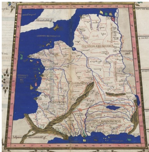
La gaule d'après Ptolémée

César ( B.G. , II, 15, 2-3 1 ) nous indique que les Ambiani avaient pour voisins les Bellovaci et les Nervii , Strabon ( Géographie , IV,3,5 2 ) qu'ils sont riverains de la mer mais il les situe après les Morini et les Bellovaci , Pline l'Ancien ( Naturalis Historia , IV, 106 3 ) les localise entre les Britanni et les Bellovaci et, plus tard, Ptolémée ( Guide Géographique , II, 9, 8) précise qu'ils sont situés entre les Bellovaci au sud et les Morini au nord.